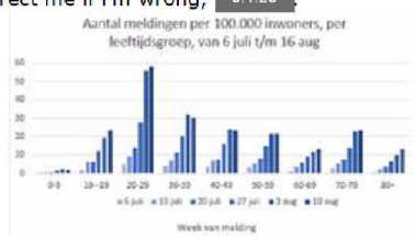
Figuur 1. Aantal meldingen per 100.000 inwoners per leeftijdsgroep in de afgelopen 6 weken.

Maandag is het R-team alleen [5.1.2e] en ze ziet zo direct niet hoe ze met dezelfde opmaak dat kan reproduceren in R (correct me if i'm wrong, [5.1.2e])